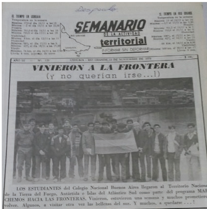
Figura 2. Estudiantes del Colegio Nacional de Buenos Aires visitan Tierra del Fuego como parte del programa Marchemos hacia las fronteras. Semanario de la actividad territorial, Año III, n° 120. (23 de noviembre de 1979). Fondo documental del Museo del Fin del Mundo.

los transeúntes; 14 reforzando de este modo, aun en la crisis final de su mandato, la imagen construida respecto de la “moderación” de Videla (Lvovich, 2020). 15