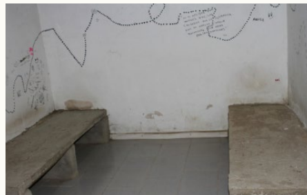
Rodher: Informe Condiciones de Detención Comisarías y Alcaldías de Entre Ríos

( Partimos de una realidad que es la detención en comisarías de personas de las cuales se sospecha han cometido delitos o contravenciones, y que desde la RODHER entendemos que las dependencias policiales no deben ser lugares de encierro ni de castigo.