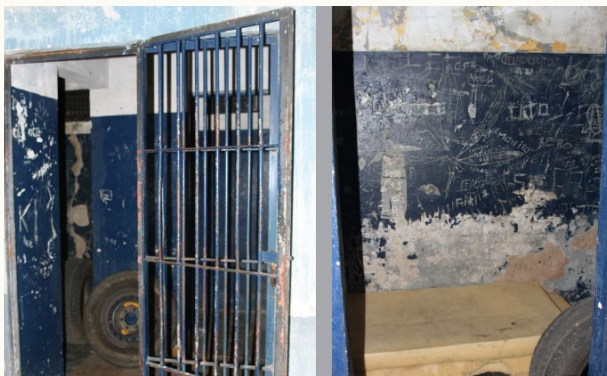
Rodher: Informe Condiciones de Detención Comisarías y Alcaldías de Entre Ríos

Desde la Red de Organismos de Derechos Humanos de Entre Ríos (RODHER) venimos realizando diversas acciones tendientes a la difusión, promoción y protección de los derechos humanos en distintos ámbitos de intervención en nuestra provincia.