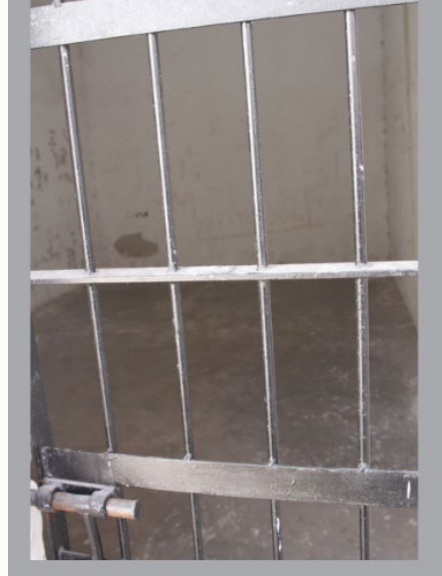
Rodher: Informe Condiciones de Detención Comisaría y Alcaldías de Entre Ríos

Dicho instrumento fue diseñado de manera tal que nos permitió recoger la polifonía de la cual surge el propio registro