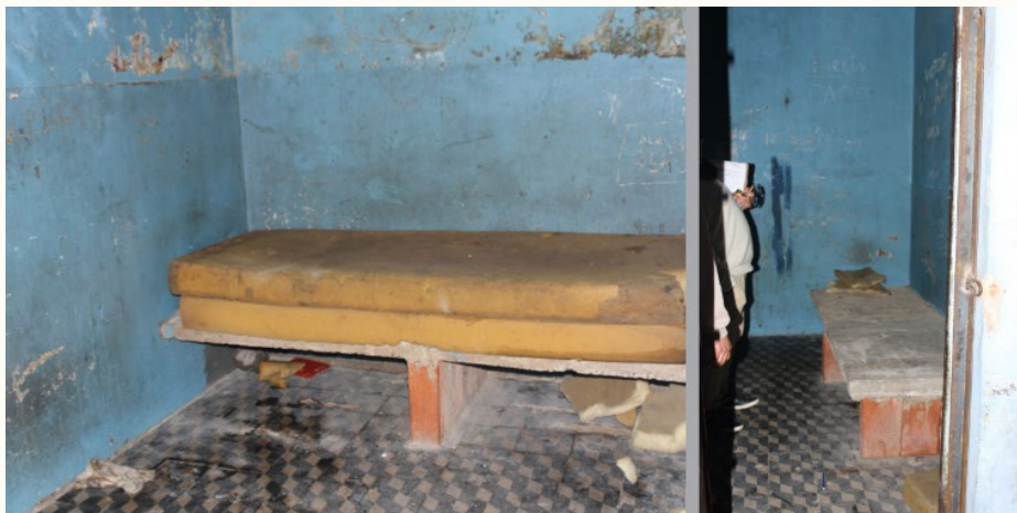
Rodher: Informe Condiciones de Detención Comisarías y Alcaldías de Entre Ríos

na penal y deben ser unidades acondicionadas para ello con personal capacitado para la guarda y cuidado de personas detenidas preventivamente.