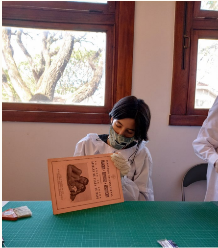
Casa por la Identidad, Espacio Memoria y Derechos Humanos

(El trabajo con el archivo implicó instancias y actividades muy diversas actualmente en proceso de desarrollo y construcción, y que pueden enriquecerse con los aportes de las diferentes formaciones de las que provienen las/los estudiantes.