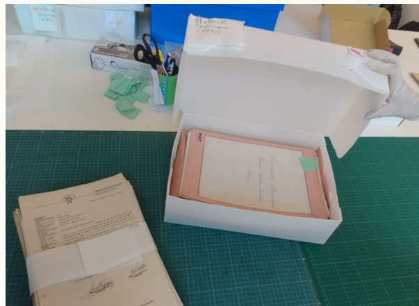
Casa por la Identidad, Espacio Memoria y Derechos Humanos

En 2018, al mismo tiempo que en Filo se desarrollaba el PST “La pregunta como origen: el Archivo Biográfico Familiar de Abuelas de Plaza de Mayo como herramienta para la construcción de identidad”, el equipo del Archivo Institucional inició tareas de diagnóstico, relevamiento, descripción, clasificación, digitalización